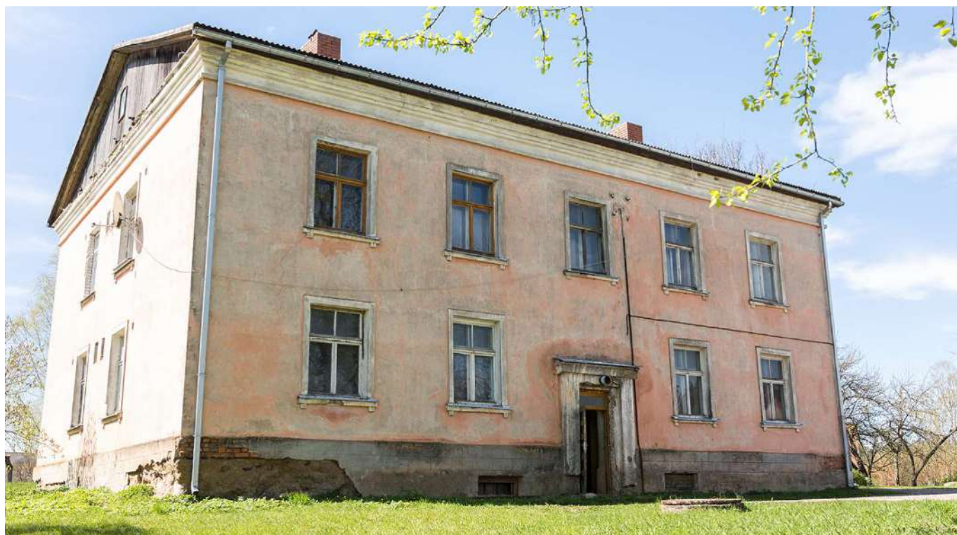
Plānota dzīvojamās ēkas pārbūve, lai tās 1. stāvā izveidotu ģimeniskai videi pietuvinātu pakalpojumu ārpusģimenes aprūpē esošajiem bērniem.

Novadā dzīvo 96 bērni ar funkcionāliem traucējumiem. Projektā “Vidzeme iekļauj” iesaistīti 37 bērni. 22 bērni saņēmuši sociālās rehabilitācijas pakalpojumus projekta ietvaros – smilšu terapiju, reitterapiju, fizioterapiju, logopēda konsultācijas un citus pakalpojumus. Atbalstu projekta ietvaros saņēmuši arī 7 bērnu ar funkcionāliem traucējumiem vecāki.