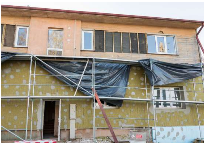
Spāres internātpamatskolas dienesta viesnīca pārtop par grupu dzīvokļiem cilvēkiem ar garīga rakstura traucējumiem.

Plānots, ka novadā 2020. gadā durvis vērs grupu dzīvoklis cilvēkiem ar garīga rakstura traucējumiem, kurā vienlaicīgi pakalpojumus varēs saņemt 16 cilvēki, kā arī dienas aprūpes centra pakalpojums un specializēto darbinīcu pakalpojums cilvēkiem ar garīga rakstura traucējumiem. Amatas novads plāno sniegt šos pakalpojumus arī citu novadu iedzīvotājiem.