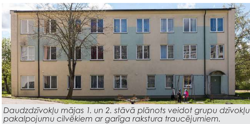
Daudzdzīvokļu mājas 1. un 2. stāvā plānots veidot grupu dzīvokļu pakalpojumu cilvēkiem ar garīga rakstura traucējumiem.

Savukārt, lai nodrošinātu cilvēkiem ar garīga rakstura traucējumiem iespēju uzsākt patstāvīgu dzīvi, Cēsis top grupu dzīvoklis, kurā pakalpojumus vienlaicīgi varēs saņemt līdz 16 cilvēkiem.