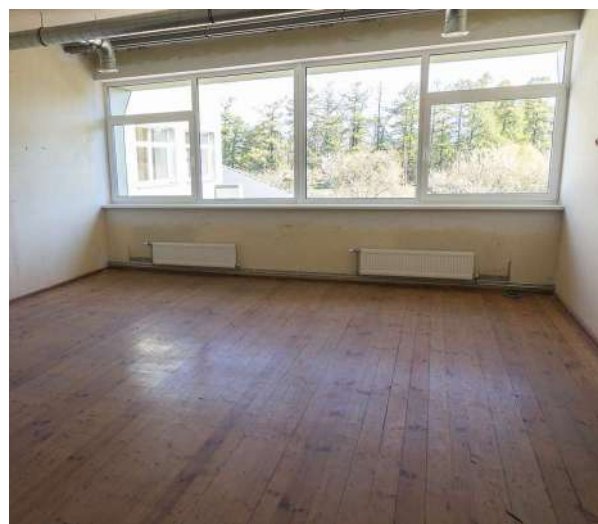
Daļu ēkas pielāgos grupu dzīvokļa pakalpojuma vajadzībām cilvēkiem ar garīga rakstura traucējumiem, bet atlikušo daļu arī turpmāk savām vajadzībām izmantos Kocēnu sporta skola.

Novadā dzīvo 32 bērni ar funkcionāliem traucējumiem. Projektā “Vidzeme iekļauj” iesaistīti 20 bērni, no tiem 14 bērni saņēmuši sociālās rehabilitācijas pakalpojumus projekta ietvaros – mākslas terapiju, kanisterapiju, mūzikas terapiju, fizioterapiju, audiologopēda, osteopāta un citu speciālistu konsultācijas. Tāpat projekta ietvaros sociālās aprūpes pakalpojumu saņem viens bērns, kuram izsniegts VDEĀVK atzinums par īpašas kopšanas nepieciešamību sakarā ar smagiem funkcionāliem traucējumiem. Atbalstu projekta ietvaros saņēmuši arī 5 bērnu ar funkcionāliem traucējumiem vecāki.