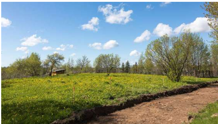
Pašvaldībai piederošā pļavā Rīgas ielā 90, taps multifunkcionālais pakalpojumu centrs "Cēsis", nodrošinot pakalpojumus bērniem ar funkcionāliem traucējumiem un cilvēkiem ar garīga rakstura traucējumiem.

Lai nodrošinātu novada iedzīvotājiem nepieciešamos sabiedrībā balstītos sociālos pakalpojumus, pašvaldība veido multifunkcionālo pakalpojumu centru "Cēsis". Tajā paredzēts izveidot dienas aprūpes centru pilngadīgām personām ar garīga rakstura traucējumiem, kā arī specializētās darbnīcas, kur būs iespējams apgūt dažādas noderīgas prasmes, kas nākotnē šiem cilvēkiem varētu palīdzēt iekļauties darba tirgū. Tāpat centrā atradīsies arī dienas aprūpes centrs un sociālās rehabilitācijas centrs bērniem ar funkcionāliem traucējumiem, kā arī tiks nodrošināts "atelpas brīdis" – īslaicīgas sociālās aprūpes pakalpojums, kas piedāvās vecākiem atjaunot spēkus, nodrošinot bērnu pieskatīšanu un aprūpi vienu vai vairākas diennaktis.