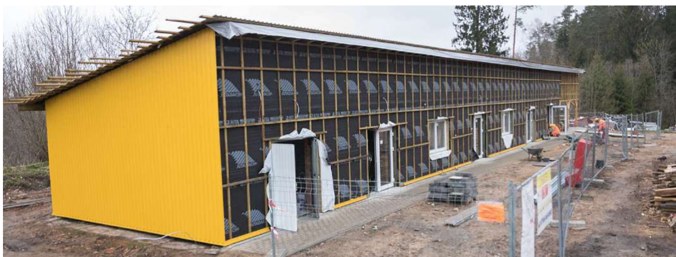
Saimniecības ēkā tiek veikti remontdarbi, lai to pielāgotu specializēto darbnīcu pakalpojumam cilvēkiem ar garīga rakstura traucējumiem.

Raunas novadā dzīvo 16 bērni ar funkcionāliem traucējumiem. Projektā "Vidzeme iekļauj" iesaistīti 4 bērni, no tiem 3 bērni projekta ietvaros saņēmuši tādas sociālās rehabilitācijas pakalpojumus kā fizioterapija, Tomatis terapija, audiologopēda, osteopāta un ergoterapeita konsultācijas. Tāpat projekta ietvaros 1 bērns, kuram izsniegts VDEĀVK atzinums par īpašas kopšanas nepieciešamību sakarā ar smagiem funkcionāliem traucējumiem, saņem sociālās aprūpes pakalpojumu.