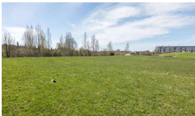
Kārķļu ielā 5, kur šobrīd ir zaļa pļava, uzbūvēs moduļu mājas, lai nodrošinātu grupu dzīvokļa pakalpojumu cilvēkiem ar garīga rakstura traucējumiem.

Novadā tiks veidots grupu dzīvoklis cilvēkiem ar garīga rakstura traucējumiem, kurā vienlaicīgi pakalpojumus varēs saņemt 16 cilvēki, kā arī dienas aprūpes centra pakalpojums un specializēto darbnīcu pakalpojums cilvēkiem ar garīga rakstura traucējumiem.