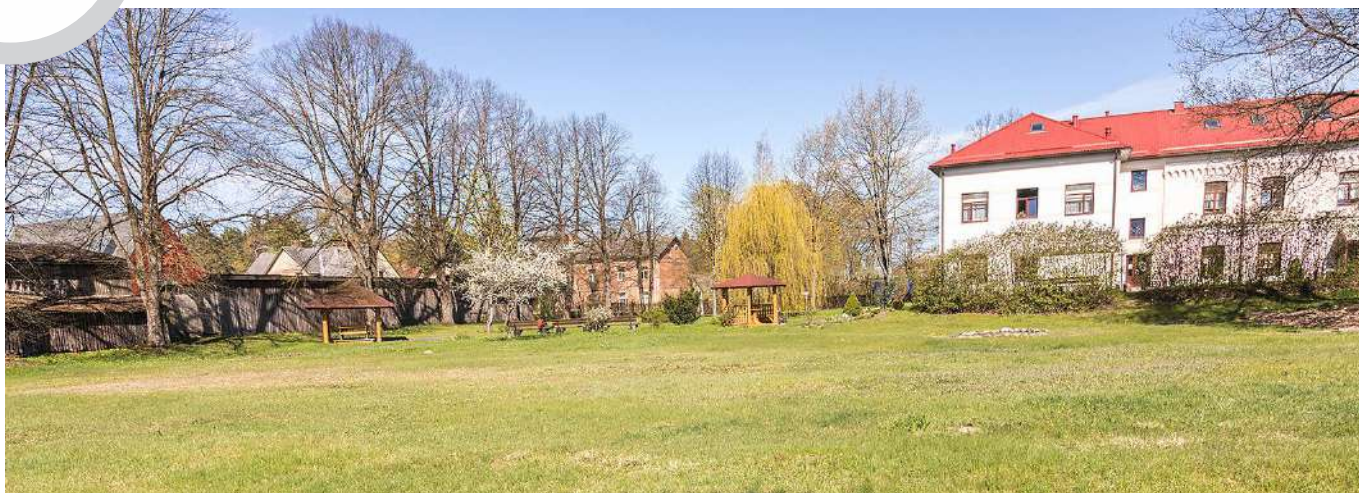
Plāvē pie pansionāta "Valmiera" taps daudzfunkcionālais pakalpojumu centrs, nodrošinot pakalpojumus bērniem ar funkcionāliem traucējumiem un cilvēkiem ar garīga rakstura traucējumiem.

Lai uzlabotu pakalpojumu pieejamību, Valmierā tiek veidots daudzfunkcionāls pakalpojumu centrs, kurā tiks nodrošināti sociālās rehabilitācijas un dienas aprūpes centra pakalpojumi bērniem ar funkcionāliem traucējumiem, kā arī specializēto darbnīcu un dienas aprūpes centra pakalpojumi cilvēkiem ar garīga rakstura traucējumiem.