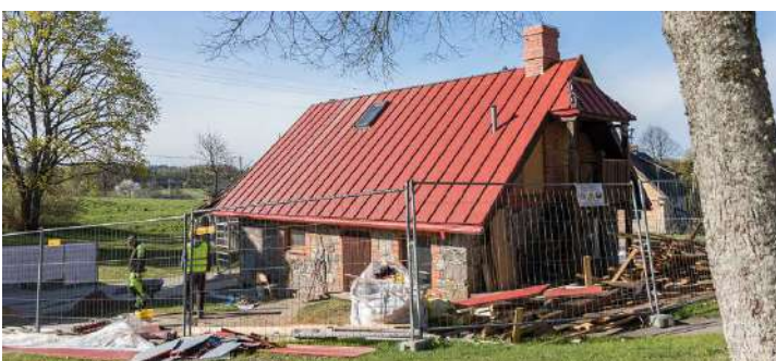
Spāres muižas teritorijā top arī sociālās rehabilitācijas centrs bērniem ar funkcionāliem traucējumiem.

Lai uzlabotu pakalpojumu pieejamību bērniem ar funkcionāliem traucējumiem, pašvaldība veido sociālās rehabilitācijas pakalpojumu centru, arī tā izveidi plānots pabeigt 2020. gadā.