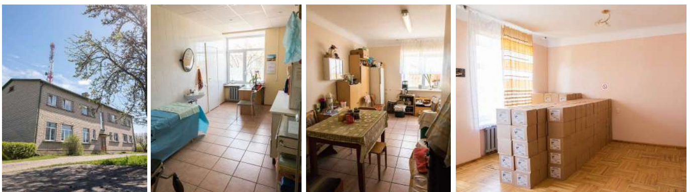
Ēkas 1.stāvu plānots aprīkot un pielāgot dienas aprūpes centra vajadzībām, savukārt pagrabstāvā tiks nodrošināts specializēto darbnīcu pakalpojums cilvēkiem ar garīga rakstura traucējumiem.

Lai nodrošinātu novada iedzīvotājiem nepieciešamos sabiedrībā balstītos sociālos pakalpojumus, Gulbenes novada Tirzas pagastā tiks veidoti grupu dzīvokļi, kur vienlaicīgi pakalpojumus varēs saņemt 16 cilvēki ar garīga rakstura traucējumiem, savukārt, Gulbenes pilsētā tiks veidoti 2 jauni pakalpojumi – dienas aprūpes centrs un specializētās darbnīcas cilvēkiem ar garīga rakstura traucējumiem.