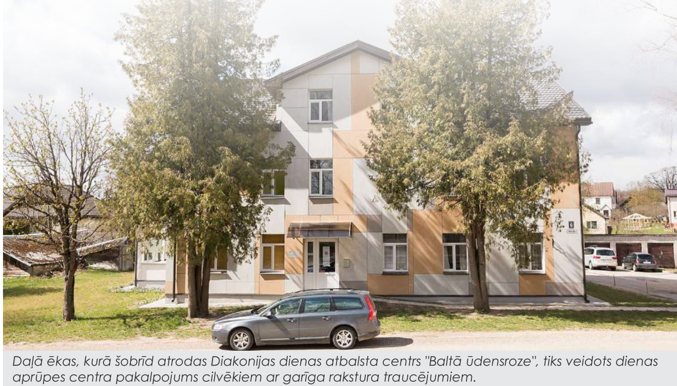
Daļā ēkas, kurā šobrīd atrodas Diakonijas dienas atbalsta centrs "Baltā ūdensroze", tiks veidots dienas aprūpes centra pakalpojums cilvēkiem ar garīga rakstura traucējumiem.

Līdzīgi domājoši cilvēki. Arī jūsu komanda. Šādām idejām atbalsts ir vajadzīgs, ir svarīgi redzēt, ka neesi viens.