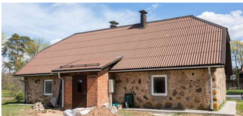
Bijušī "Mazaldaru" pasta ēka pārtop par specializēto darbnīcu cilvēkiem ar garīga rakstura traucējumiem.

Naukšēnu novadā dzīvo 11 bērni ar funkcionāliem traucējumiem. Projektā "Vidzeme iekļauj" iesaistīti 3 bērni, no tiem 1 bērns saņēmis sociālās rehabilitācijas pakalpojumus projekta ietvaros (fizioterapiju).