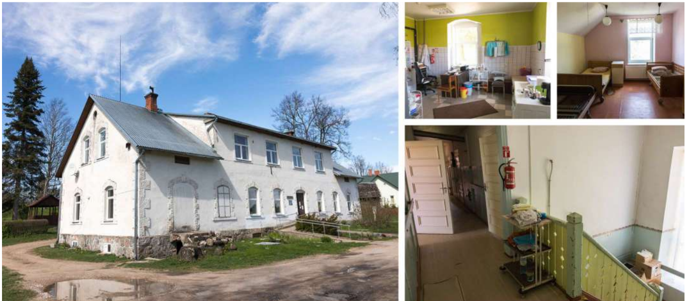
Ēka tiks pārveidota par dzīvojamo māju, izveidojot tajā grupu dzīvokļu pakalpojumu cilvēkiem ar garīga rakstura traucējumiem.

Patstāvīgu dzīvi novadā uzsācis viens cilvēks, kas iepriekš saņēmis ilgstošas sociālās aprūpes un sociālās rehabilitācijas institūciju pakalpojumus, plānots, ka patstāvīgu dzīvi Gulbenes novadā uzsāks vēl 12 cilvēki ar garīga rakstura traucējumiem, kuri šobrīd saņem ilgstošas sociālās aprūpes un sociālās rehabilitācijas institūciju pakalpojumus.