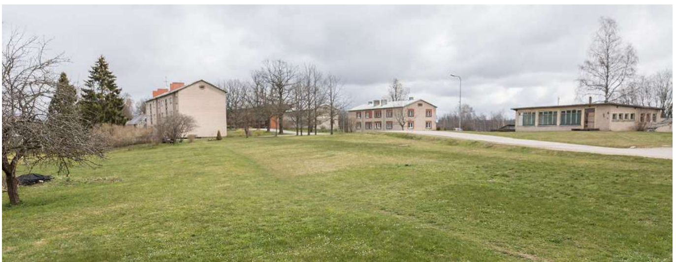
Plāvē netālu no BJĀAC "Ozoli" būs jaunu dzīvojamo māju, lai nodrošinātu ģimeniskai videi pietuvinātu pakalpojumu ārpusģimenes aprūpē esošajiem bērniem.

Savukārt, lai rūpētos par bērniem ārpusģimenes aprūpē, tiks reorganizēts esošais BJĀAC "Ozoli", izveidojot 2 atsevišķus pakalpojumus - ģimeniskai videi pietuvinātu pakalpojumu un jauniešu mājas pakalpojumu.