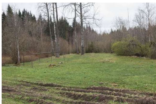
Blakus Gatartas pensionātam tiks būvēta ēka, kurā veidos grupu dzīvokļa pakalpojumu cilvēkiem ar garīga rakstura traucējumiem.

Lai varētu nodrošināt kvalitatīvus sociālos pakalpojumus, pašvaldība veido grupu dzīvokļa pakalpojumu, kurā vienlaicīgi pakalpojumus varēs saņemt 8 cilvēki, kā arī specializēto darbnīcu pakalpojumu cilvēkiem ar garīga rakstura traucējumiem. Pakalpojumu sniegšanu Raunas novada pašvaldība plāno uzsākt 2021. gada sākumā, un paredzēts, ka šos pakalpojumus pašvaldība nodrošinās arī citu novadu iedzīvotājiem.