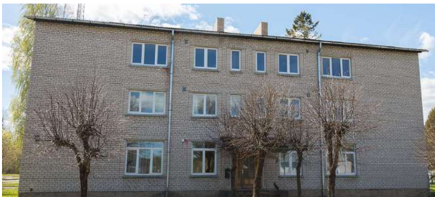
Veicot daudzdzīvokļu mājas pārbūvi, tiks veidots grupu dzīvokļa pakalpojums cilvēkiem ar garīga rakstura traucējumiem.

Lai turpmāk varētu nodrošināt kvalitatīvus sabiedrībā balstītus sociālos pakalpojumus, novadā top grupu dzīvoklis cilvēkiem ar garīga rakstura traucējumiem, kurā vienlaicīgi pakalpojumus varēs saņemt 16 cilvēki, kā arī tiek veidots dienas aprūpes centra pakalpojums cilvēkiem ar garīga rakstura traucējumiem.