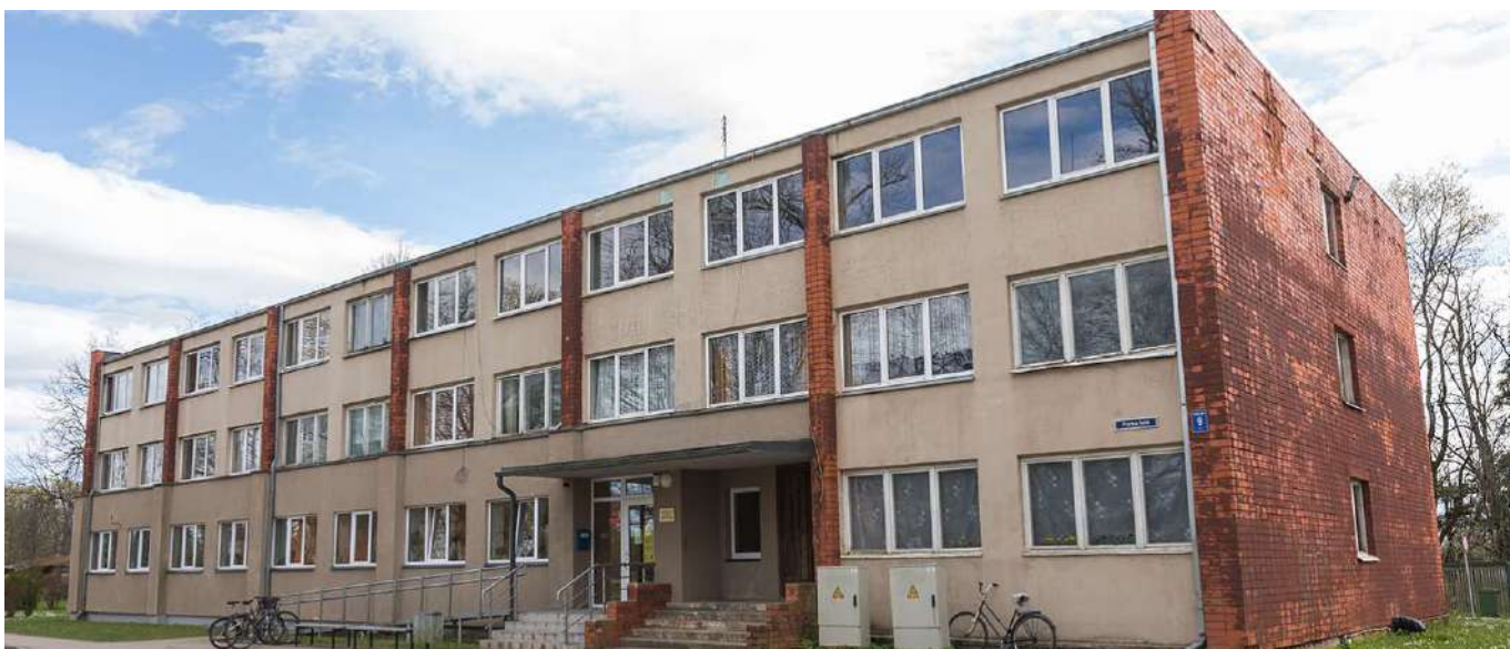
Daudzdzīvokļu mājā, kuras 1.stāvā atrodas Mazsalacas pilsētas bibliotēka, plānots veidot grupu dzīvokļa pakalpojumu cilvēkiem ar garīga rakstura traucējumiem.

Lai varētu nodrošināt kvalitatīvus sociālos pakalpojumus, pašvaldība veido grupu dzīvokļa pakalpojumu, kurā vienlaicīgi pakalpojumus varēs saņemt 13 cilvēki, kā arī dienas aprūpes centra pakalpojumu cilvēkiem ar garīga rakstura traucējumiem.