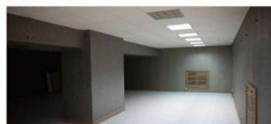
Biroju ēkā, kurā atradās vairāku valsts iestāžu filiāles, plānots veidot daudzfunkcionālu sociālo pakalpojumu centru, nodrošinot sociālos pakalpojumus bērniem ar funkcionāliem traucējumiem un cilvēkiem ar garīga rakstura traucējumiem.