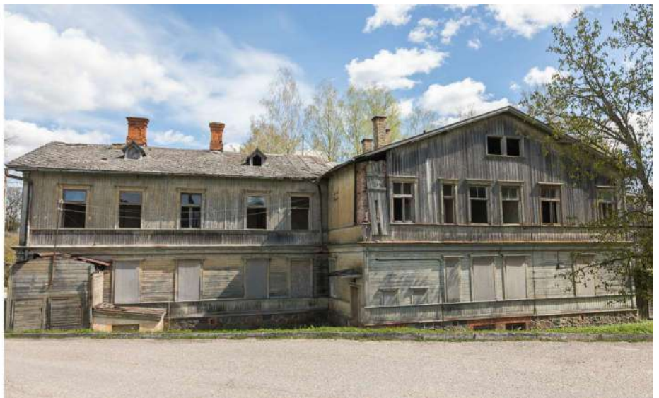
Pārbūvējot Rūjienas vecās slimnīcas ēku, tajā tiks izveidots dienas aprūpes centra un grupu dzīvokļu pakalpojums cilvēkiem ar garīga rakstura traucējumiem.

Rūjienas novadā dzīvo 23 bērni ar funkcionāliem traucējumiem. Projektā “Vidzeme iekļauj” iesaistīti 16 bērni. No tiem 10 bērni saņēmuši sociālās rehabilitācijas pakalpojumus projekta ietvaros – fizioterapiju, kanisterapiju, mūzikas terapiju, audiologopēda un uztura speciālista konsultācijas. Tāpat atbalstu projekta ietvaros saņēmuši arī 3 bērnu vecāki.