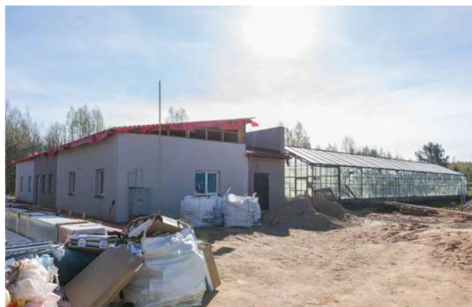
Ēkā, kurā kādreiz notika arodapmācības un dārzniecības nodarbības, šobrīd top dienas aprūpes centrs un specializētās darbnīcas cilvēkiem ar garīga rakstura traucējumiem.