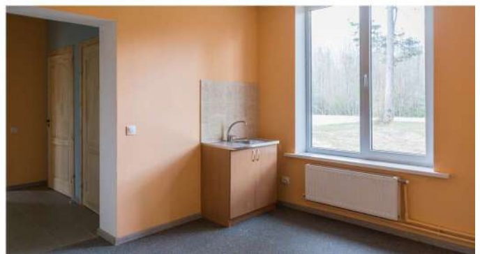
Dienas aprūpes centrs cilvēkiem ar garīga rakstura traucējumiem pavisam drīz uzsāks savu darbību.

Lai varētu nodrošināt kvalitatīvus sociālos pakalpojumus, pašvaldība veido dienas aprūpes centra pakalpojumu cilvēkiem ar garīga rakstura traucējumiem, tajā vienlaicīgi pakalpojumus varēs saņemt 13 cilvēki. Pakalpojumu sniegšanu Lubānas novada pašvaldība plāno uzsākt 2020. gada vasarā, un paredzēts, ka šos pakalpojumus pašvaldība nodrošinās arī kaimiņu novadu iedzīvotājiem.