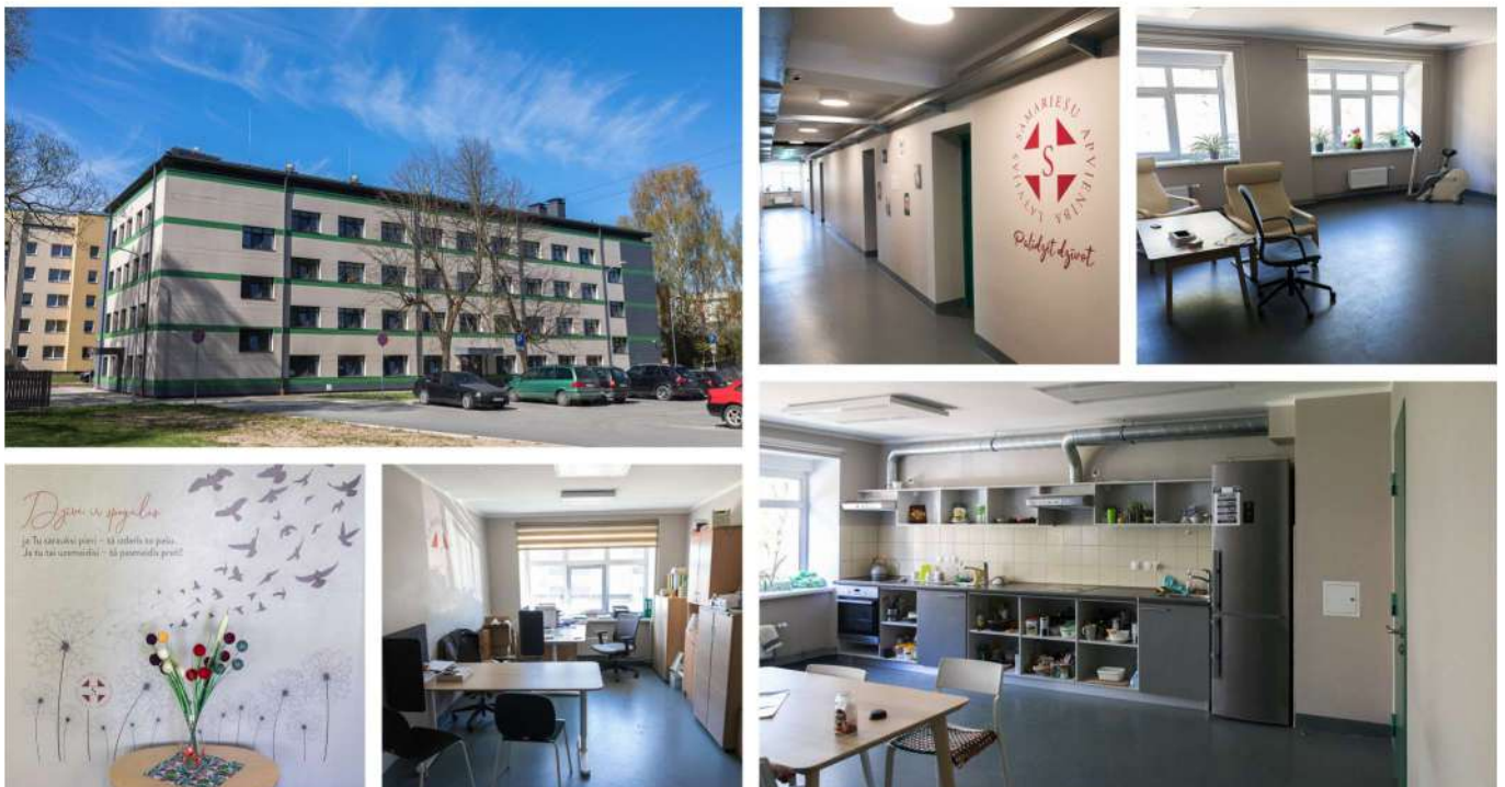
Dažādu sociālo grupu kopdzīvojamā ēka, kurā pieejams arī grupu dzīvokļa pakalpojums.

Lai varētu nodrošināt kvalitatīvus sociālos pakalpojumus, pašvaldībā 2019. gada augustā durvis vēris grupu dzīvokļa pakalpojums cilvēkiem ar garīga rakstura traucējumiem, kurā vienlaicīgi pakalpojumus var saņemt 16 cilvēki.