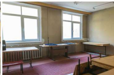
Ēkas 1.stāvā tiks veidots dienas aprūpes centrs cilvēkiem ar garīga rakstura traucējumiem.

Lai sniegtu atbalstu bērniem, kas nonākuši ārpusģimenes aprūpē, novadā tiek veidota jauniešu māja un ģimeniskai videi pietuvināts pakalpojums. Pašvaldība šo pakalpojumu nodrošinās arī citu novadu iedzīvotājiem. Paredzēts, ka gan jauniešu mājā, gan ģimeniskai videi pietuvinātā pakalpojumā atbalstu varēs nodrošināt 8 bērniem.