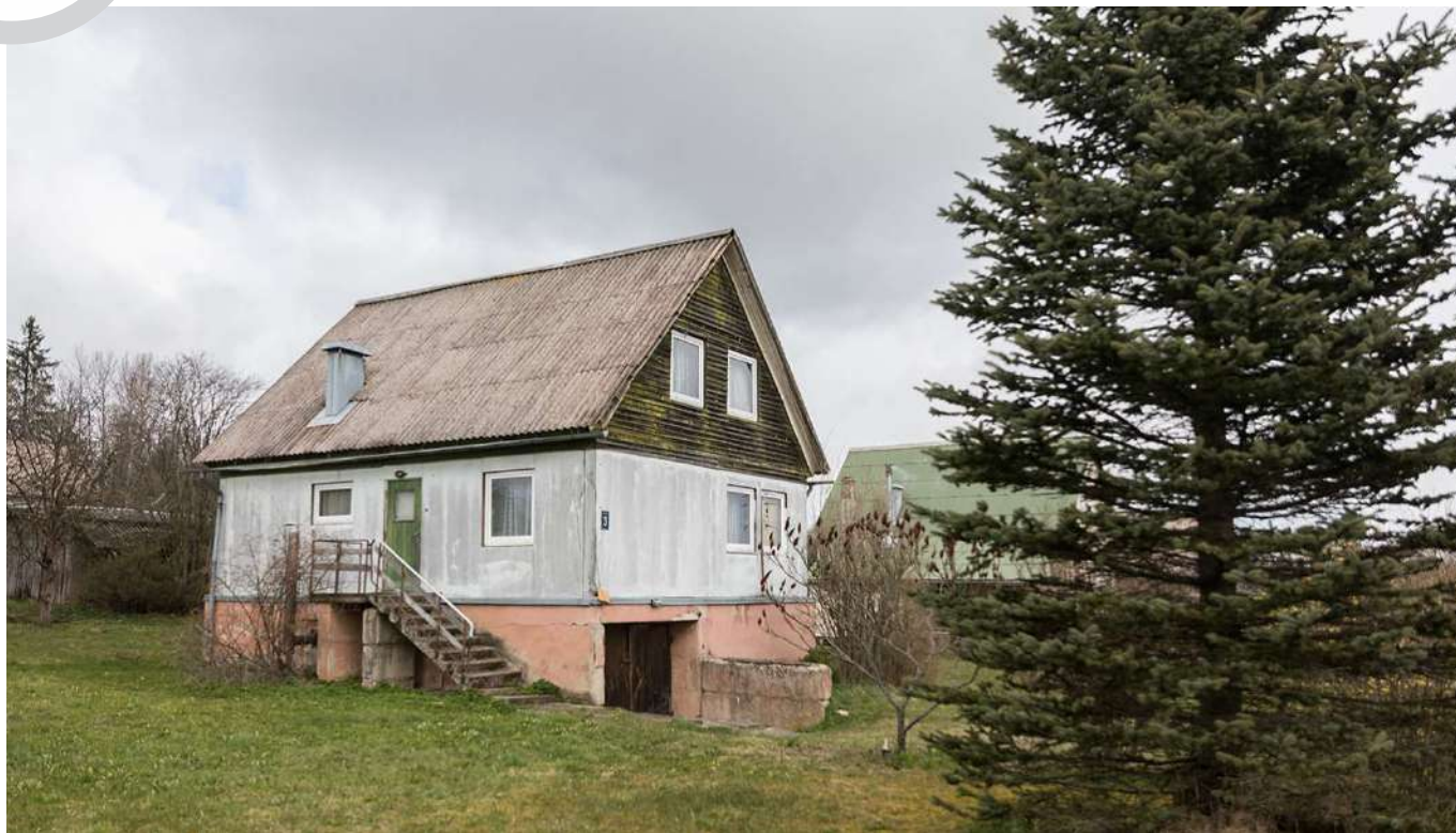
Līvānu tipa māju pārbūvēs, lai ārpusģimenes aprūpē esošajiem pusaudžiem nodrošinātu jauniešu mājas pakalpojumu.

Novadā dzīvo 111 bērni ar funkcionāliem traucējumiem. Projektā "Vidzeme iekļauj" iesaistīti 34 bērni, no tiem 13 bērni saņēmuši sociālās rehabilitācijas pakalpojumus projekta ietvaros – mūzikas, mākslas, smilšu terapijas, fizioterapiju, ārstnieciskās masāžas, Montessori nodarbības, logopēda konsultācijas un citus pakalpojumus. Atbalstu projekta ietvaros saņēmuši arī 5 bērnu ar funkcionāliem traucējumiem vecāki.