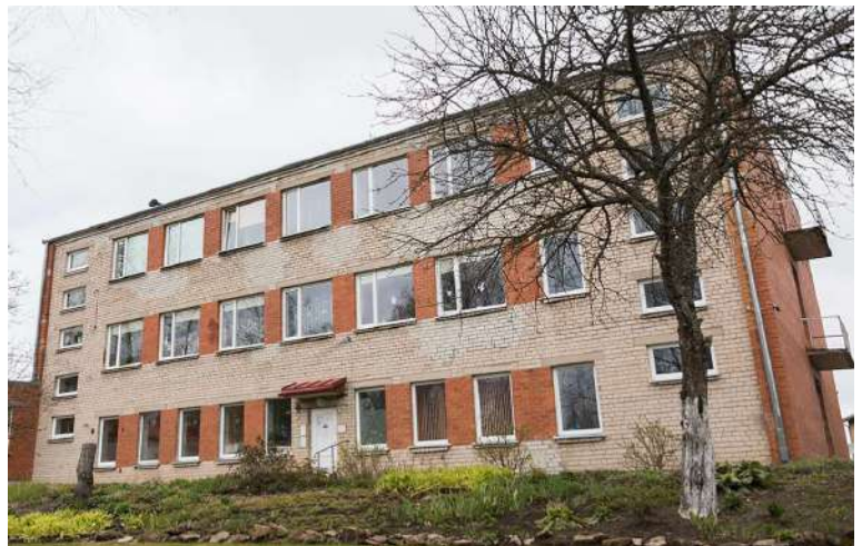
Ēkas 2. un 3. stāvā tiks veidots grupu dzīvokļa pakalpojums cilvēkiem ar garīga rakstura traucējumiem.

Lai nodrošinātu kvalitatīvus sociālos pakalpojumus cilvēkiem ar garīga rakstura traucējumiem Madonas pilsētā tiek veidots dienas aprūpes centra pakalpojums (skat.attēlu 12.lpp.), bet Liezeres pagastā, ēkā, kurā šobrīd atrodas BJĀAC "Ozoli" tiks veidots grupu dzīvokļa pakalpojums, kurā vienlaicīgi pakalpojumus varēs saņemt 16 cilvēki.